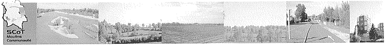
Schéma de Cohérence Territoriale Moulins Communauté

Délibération n°C.11.158 du Conseil Communautaire en date du 16 décembre 2011 approuvant le SCOT