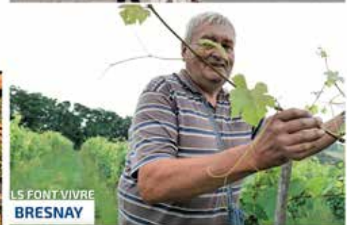
LES FONT VIVRE BRESNAY