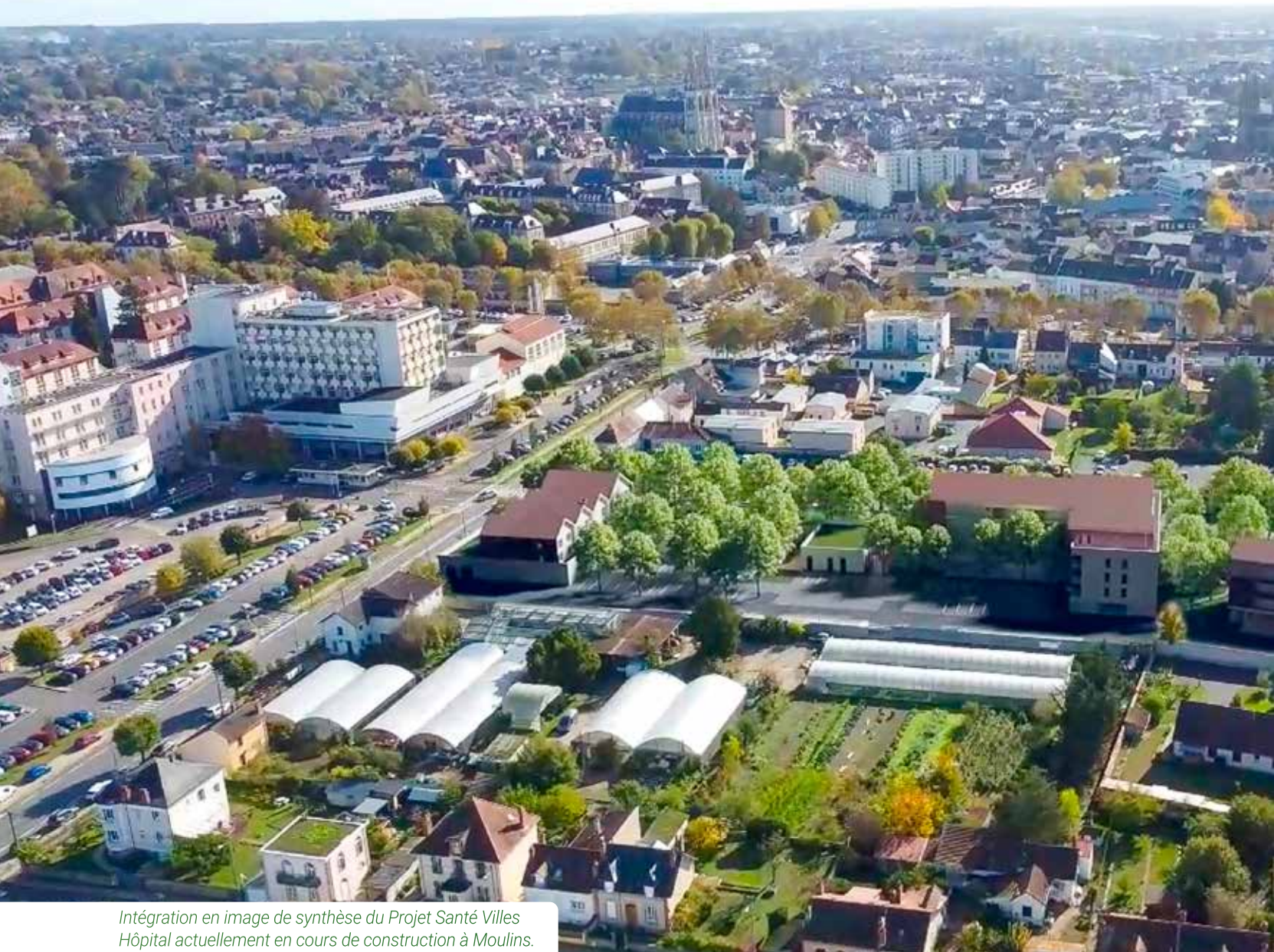
Intégration en image de synthèse du Projet Santé Villes Hôpital actuellement en cours de construction à Moulins.

Moulins Communauté est engagée dans plusieurs actions importantes en faveur de la santé. En fil rouge de ce travail : le contrat local de santé, un document complet qui définit la stratégie et les leviers d'actions pour les années à venir.