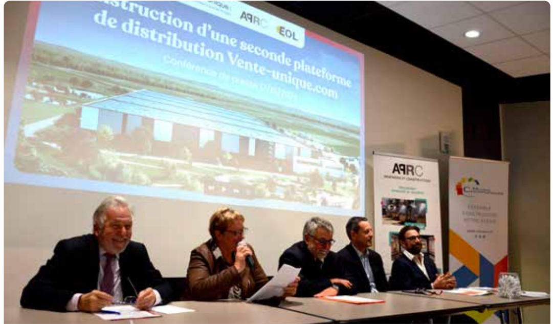
Les représentants de Vente-Unique sont venus à Moulins durant l'automne, afin de présenter le projet actuellement en construction sur le LOGIPARC 03 : un bâtiment logistique de plus de 60 000 m 2 .